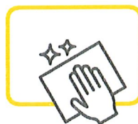
1 ardoise et 1 chiffon