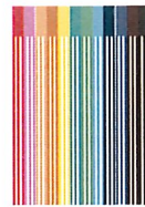
12 feutres de couleur