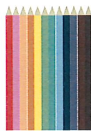
12 crayons de couleur